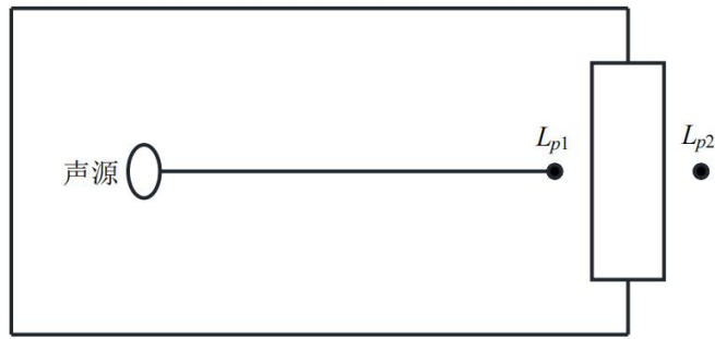
图 4-1 室内声源等效为室外声源图例