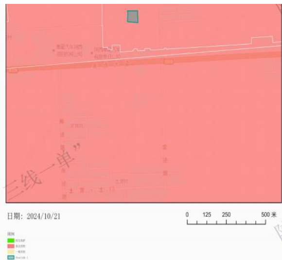
图 1-1 本项目与环境管控单元对照分析示意图

根据陕西省“三线一单”数据应用系统叠图分析可知，本项目属于重点管控单元，不涉及生态保护红线。项目与环境管控单位对照分析示意图如下图所示：